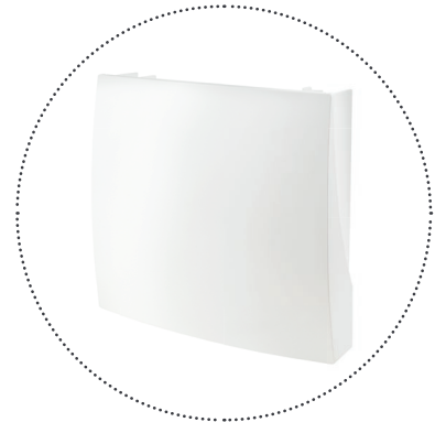
Q gateway 5 batteriebetrieben oder für Stromversorgung erhältlich

Die umfangreichen Funktionen machen das Q gateway 5 zur ultimativen Lösung bei Anwendungen und Projekten, die eine vollständige Energieautonomie am Einsatzort der Gateways erfordern. Q gateway 5 in Verbindung mit den Leistungen der Q SMP trägt zu einer erheblichen Einsparung von Zeit, Aufwand und Kosten bei.