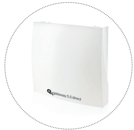
Q gateway 5.5 direct ist batteriebetrieben oder für die Stromversorgung verfügbar

Das Q gateway 5.5 direct wird ab Werk mit einer SIM-Karte ausgestattet und ausgeliefert – somit entfällt die aufwändige SIM-Karten-Verwaltung. Sämtliche Verwaltungs- und Datenerfassungsaufgaben des Gateways steuern wir über die QUNDIS Smart Metering Plattform .